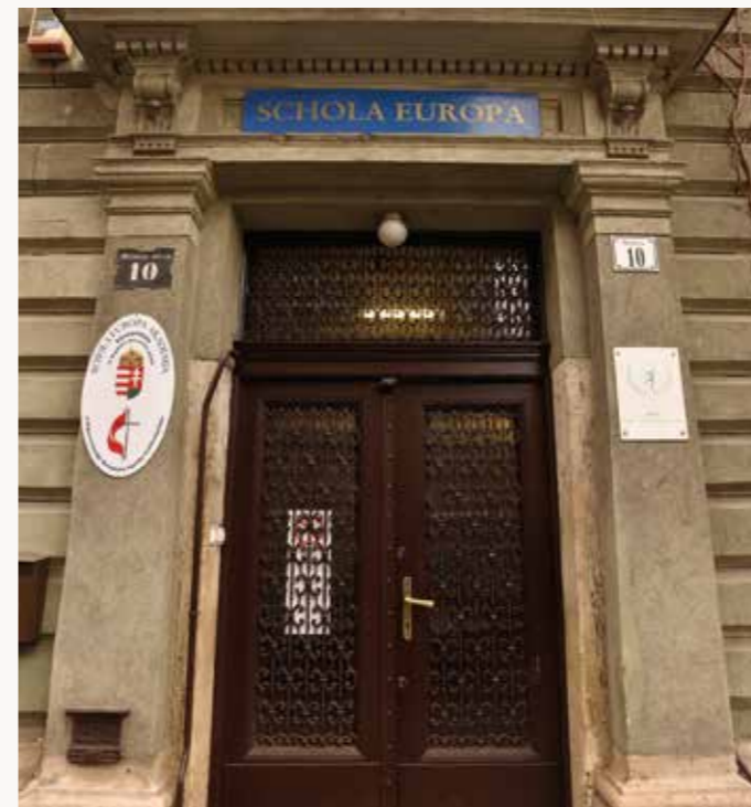
A Magyarországi Metodista Egyház fenntartásában működik a Murányi utcai „Schola Europa Akadémia” Középiskola és Alapfokú Művészeti Iskola